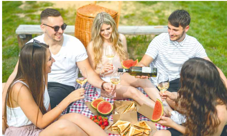
■ Léto ve Znojmě je vždy ve znamení pohody, přátelských setkání a odpočinku.

Prázdninové víkendy bývají náročné. Právě proto letní program nabízí Hradební pondělí v Jižním hradebním příkopu pod Vlkovou věží, které představí pohádkové vystoupení, ukázkou dravého ptactva, střelbu z luku, přehlídku zbraní a zbroje, historické vojenské ležení a šermířské souboje. Hradební pondělí začíná vždy v 10.00 a doplňuje tak tematickou prohlídku hradebního opevnění, na kterou se mohou návštěvníci vydat od dubna do října denně v 9.30 a 13.30.