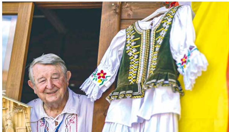
■ Přátelé ze Slovenska nemohou chybět.