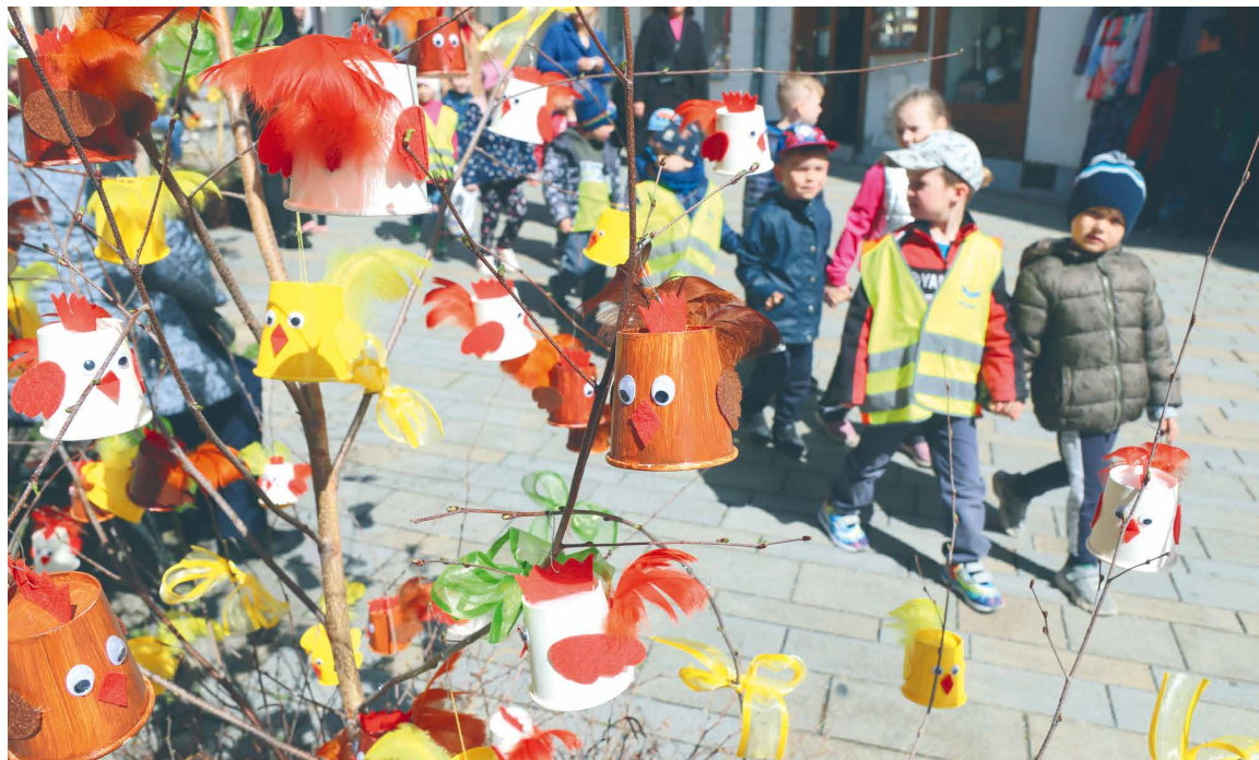
■ Obrokovu ulici opět zkrášlí břízky s výzdobou dětí místních škol.

Především jsou ale Velikonoce nejvýznamnějším křesťanským svátkem, kdy slavnostně vyzdobené kostely vítají v uspěchané době k duševnímu zklidnění nejen věřící. Více na str. 8–9. lp