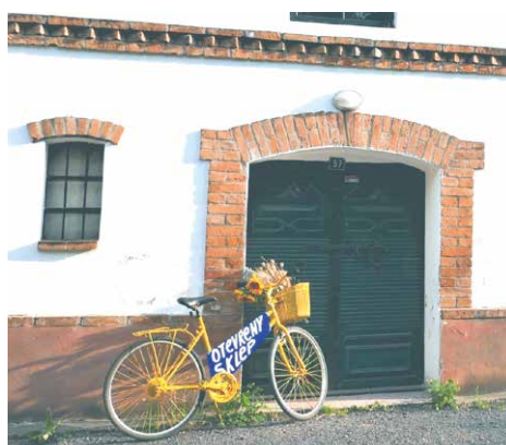
■ Žluté kolo u vchodových dveří vždy označuje vinný sklep ve Vrbovci otevřený veřejnosti.

Hned v několika vinařských obcích na Znojemsku drží vinaři od května až do začátku října stálou službu, díky které máte jistotu, že v místních sklepních uličkách najdete vždy alespoň jeden vinný sklep otevřený pro veřejnost. Je připraven vás, jak se patří, „po vinařsku“ pohostit a občerstvit. Služby si přitom vinaři střídají obvykle po týdnech a v hlavní sezóně (zejména o víkendech) jich občerstvení nabízí i několik najednou.