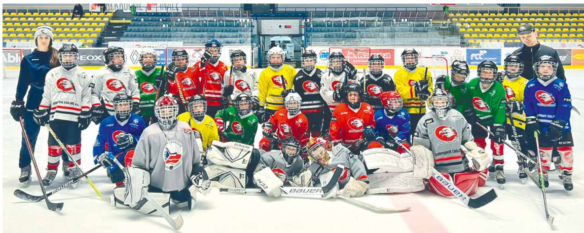
■ Znojmeští orlíci těšící se na Bajocup.