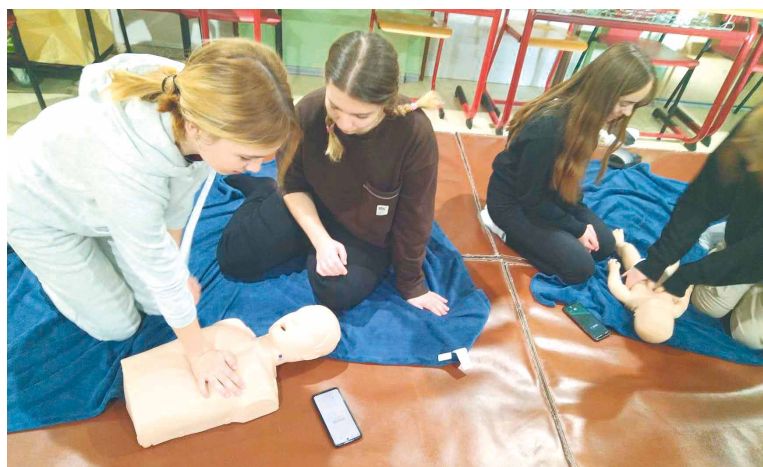
■ Nácvik první pomoci.