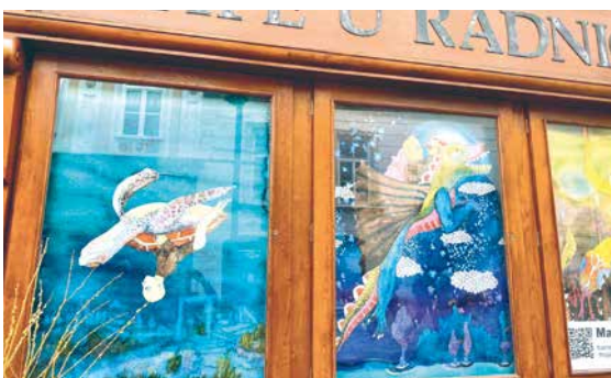
■ Galerie Ve Skle.