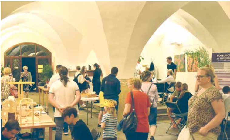
■ O noční návštěvu muzejních prostor je vždy zájem.