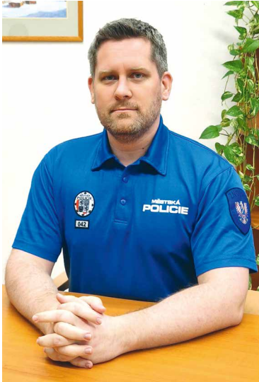
■ Petr Hladký.

Stačí vyjít z toho, jaké vybavení mají strážníci ve svých vozech. V první řadě bych rozhodně zmínil defibrilátory. U náhlé srdeční příhody rozhodují minuty a strážníci v ulicích jsou často ti první, kteří se k pacientovi dostanou. Dále mají strážníci v autech hasicí přístroje, záchranné vesty a lana, batohy první pomoci, balistické vesty, vybavení pro odchyt zvířat, testy na drogy, termovizi nebo i startboostery, kte-