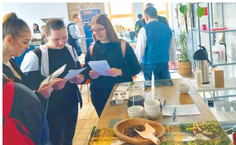
■ Žáci si na bratislavském festivalu rozšiřovali znalosti o kávě.