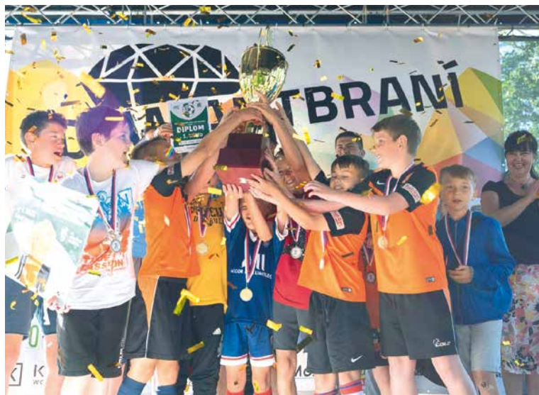
■ Finálový den futsalové ligy SVČ Znojmo uvidíte ve sportovní hale v Horním parku, odkud bude také streamován.