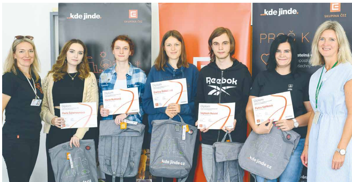
■ Znojemští gymnazisté se právem chlubí svými úspěchy. Na snímku absolventi jaderné maturity.

„Naši studenti mají možnost se rozvíjet nejen v přírodovědných oborech, ale také v cizích jazycích. Šestačtyřicet studentů maturitního