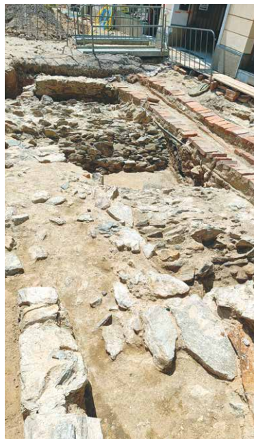
■ Středověké zdivo pod povrchem ulice odkryté archeology.