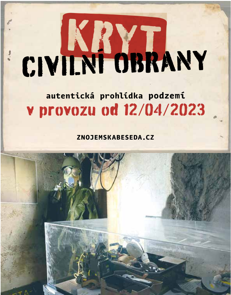
■ Prohlídka krytu je doplněna o autentické exponáty.

Cesta do krytu nyní vede přes klasickou trasu podzemí, dále i adrenalinovou trasu s označením náročnosti 2, která přináší zúžené průchody. „Nejsložitější otázkou bylo, jak propojit