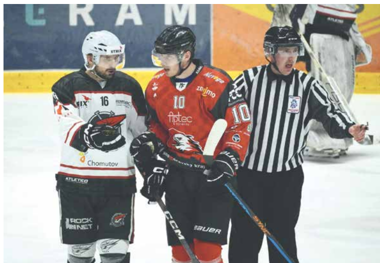
■ Orli hrají o postup do vyšší soutěže.

Z nedělního třetího finálového utkání 2. ligy na ledě pražských Letňan bylo odehráno jen necelých jedenáct minut.