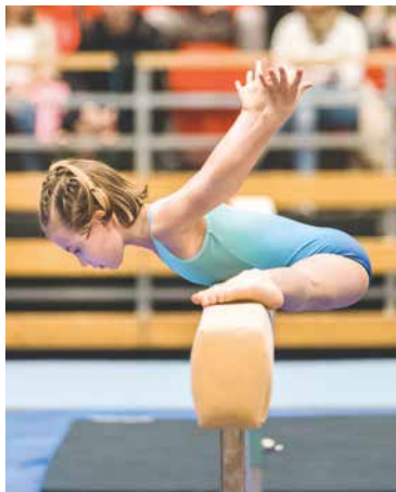
■ Cvičení na kladině.

„Jsme rádi, že je náš závod tolik populární mezi celou gymnastickou rodinou. Však také máme být na co hrdí. Opět se sešla skvělá parta rodičů, a i když se z velké většiny účastníci takové velké akce vůbec poprvé, vše fungovalo jako švýcarské hodinky. Děkuji vedení města Znojma, které udělilo záštitu našemu závodu, věnovalo poháry i spoustu cen a především finančně dlouhodobě podporuje činnost našeho klubu. Bylo nám ctí, že na zahájení přišla osobně všechny závodníky přivítat