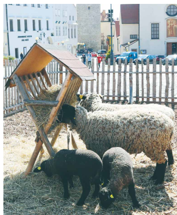
■ Ovečky na Masarykově náměstí.