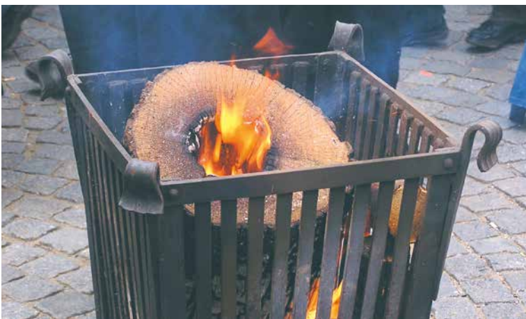
Koše na oheň poskytnou lidem při opékání špekáčků větší komfort a bezpečí.