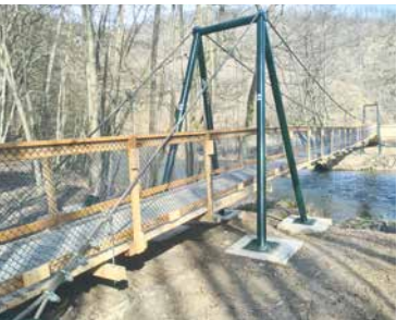
■ Od silnice je lávka vzdálena asi 2 km méně přístupným terénem.

Český a rakouský park slavnostně otevřely novou visutou lávkou pro pěší přes řeku Dyji. Lidé ji najdou v lokalitě U Poustevníka poblíž Hardeggu.