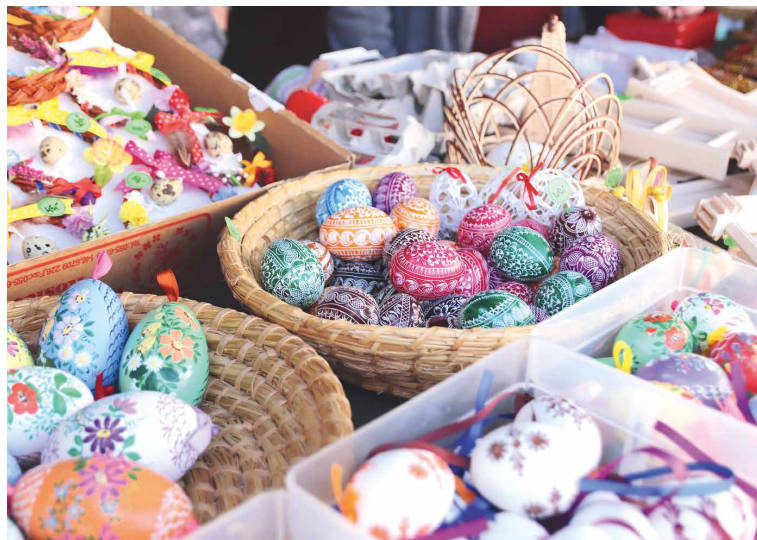
■ Na velikonočních trzích budou ke koupi nejrůznější motivy malovaných vajíček.

8.40 MŠ Pražská 98, 8.50 MŠ Prámínek, 9.00 MŠ Dělnická, 9.15 MŠ Pražská 80, 9.30 MŠ nám. Armády, 9.45 MŠ nám. Republiky, 10.00 MŠ Rudoleckého, 10.10 MŠ Holandská, 10.30 ZŠ Václavské nám., 11.00 ZŠ Příměťice, 12.50 Dětský domov Znojmo, 13.00 ZŠ a MŠ JUDr. Mareše, 14.00 ZŠ Mládeže, 14.30 Kroužek bubnování / AkceZnojmo.cz, 14.45 MŠ Příměťice, 15.10 ZŠ nám. Republiky – školní družina, 15.30 Hudební škola YAMAHA, 16.00 Hudební škola Vít-Music, 16.30 SVC Znojmo – taneční kroužky