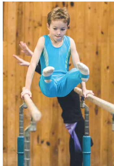
■ Cvičení na bradlech.