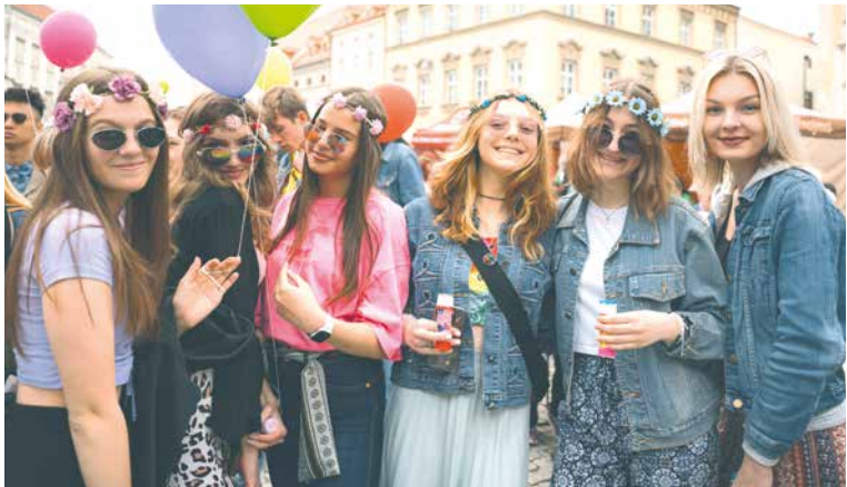
■ Tradice majálesu je spojena s rozmachem univerzit v 15. století. Už tehdy se ustálil zvyk tolerovat studentskou recesi.

do cíle na Horním náměstí. Zde bude na pódiu probíhat program, na jehož skladbě se podíleli studenti společně se Znojemskou Besedou. Vystoupí v 15.00 ATD BAND, 16.15 MIGHTY SHAKE, 17.00 GLEB ZOO, 18.15 CSB (Crazy Steps Breakers), 19.00 STEIN27, 20.15 CSB (Crazy Steps Breakers) a ve 21.00 CALIN. Vedle kapel a tanečních vystoupení budou moderátoři Láda Koubek a Šimon Král vyhlášovat také soutěž o krále a královnu majálesu (14.00) i její výsledek a také vítěze průvodu (16.00). lp