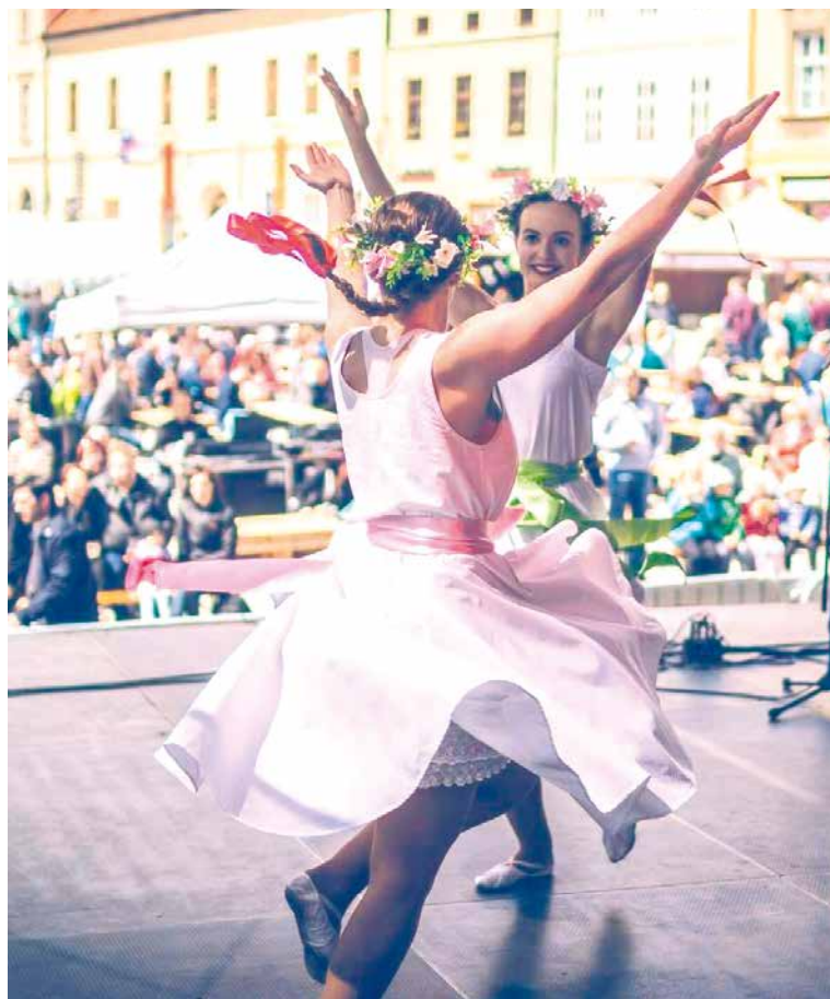
■ Májové dny jsou vítanou příležitostí k zábavě a setkávání.

Na nepřehlédnutelném Festivalu vín VOC Znojmo můžete očekávat cimbálovou muziku, skvělá vína, dobré jídlo a pohodu typickou pro jižní Moravu. S otevřenou náručí vás bude vítat Muzejní noc i rodinné Diamantbrání. Více se dozvíte ve speciálu Májové slavnosti uvnitř LISTŮ.