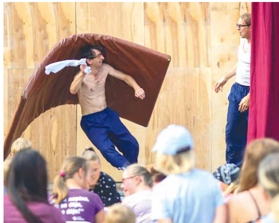
■ Nejen vystoupení herců Divadla Bolka Polívky se ponese v lehkém komediálním duchu. Divadelní festival tím přispěje k pohodovému začátku léta ve Znojmě.