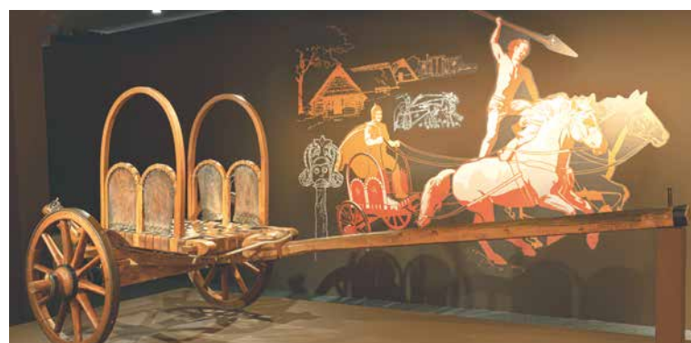
■ Na výstavě Keltové je k vidění také rekonstrukce keltského vozu.