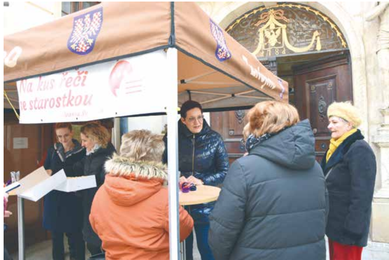
■ Starostka s diskutujícími.

Nepříjemné překvapení nám připravila Česká pošta. S uzavřením dvou poboček rozhodně nesouhlasíme. Nic