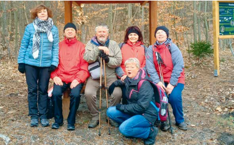
■ Zkušení turisté ví, že do přírody Národního parku Podyjí musí na EUROVÝŠLAP vyrazit ve správné obuvi a s dobrou náladou.