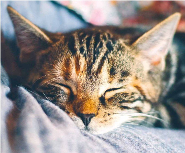
■ Kočka patří mezi nejoblíbenější domácí mazlíčky. Zcela jiná situace je u koček toulavých.