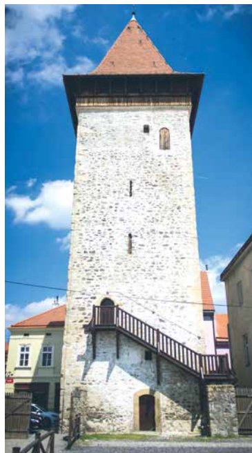
■ Vlkova věž je veřejnosti otevřena v dubnu a květnu vždy o víkendech a svátcích.

Letos poprvé bude k dispozici také nově vydaný Kalendář akcí VOC Znojmo, v němž budou informace o ak-