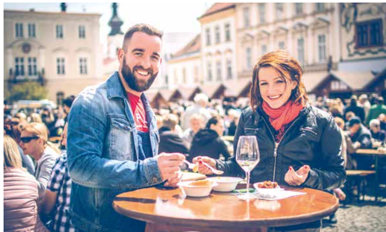
■ Dobrá nálada, skvělá vína a chutné jídlo jsou na festivalu samozřejmostí.

Festival také na jeden den změní názvy některých přilehlých ulic na odrudové, a to ulici Obrokovu na Sauvignonovu, Slepíčí trh na Ryzlinkový trh a Václavské náměstí se stane Veltlínským náměstím. Na všech