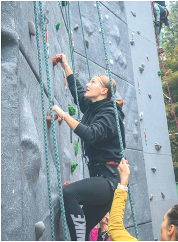
■ Venkovní lezecká stěna v Leskách funguje od minulého roku. Návrh na její vybudování zvítězil u veřejnosti v projektu Tvoříme Znojmo 2020.

Všechny potřebné informace o participativním rozpočtu jsou začleněny v dokumentu Pravidla 2024. Definují veškeré náležitosti, které musí projekt splňovat a obsahují také samotný přihlašovací formulář návrhu. Kdo si neví rady, může kontaktovat koordinátorku projektu Simonu Chmelíkovou.