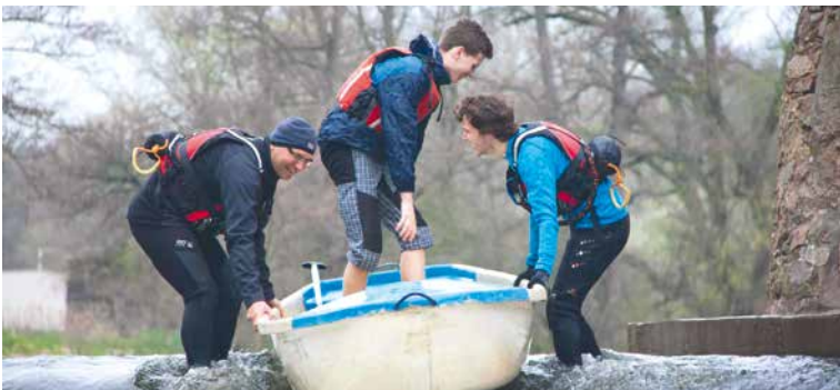
Ve snaze překonat řeku Dyji musí občas vodáci vzít loď do rukou a přenést ji.

oddílu. Podrobnosti k výše popsané akci i dalším, které vodáci na sezónu 2023 připravují, najdete na webu centrumvodarna.cz. lp