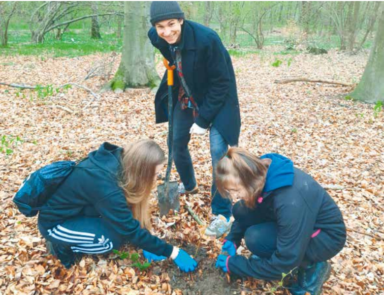
Den Země také lidé oslavují výsadbou stromů, keřů i květin.

veřejnost. Lidé si budou moci opéci špekáčky, děti se zabaví na stanovištích s úkoly a všichni uvidí prezentace lesnictví a ochrany přírody, chov a ukázkou ryb, tažného koně, stromolezce, včelaře, chov domácích mazlíčků i hmyz jako potravinu nové generace. Seznámí se se správným tříděním odpadu a jak se bezpečně pohybovat po lese. V 16.00 hod. budou vyhlášeny výsledky výtvarné soutěže Les nás baví a od 16.30 hod. je připravena ukázkou práce s dravci. Za pestrý programovou nabídkou stojí Městské lesy Znojmo, město v projektu Zdravé město Znojmo a partneři. Vstup na Den Země je pro všechny zdarma. lp