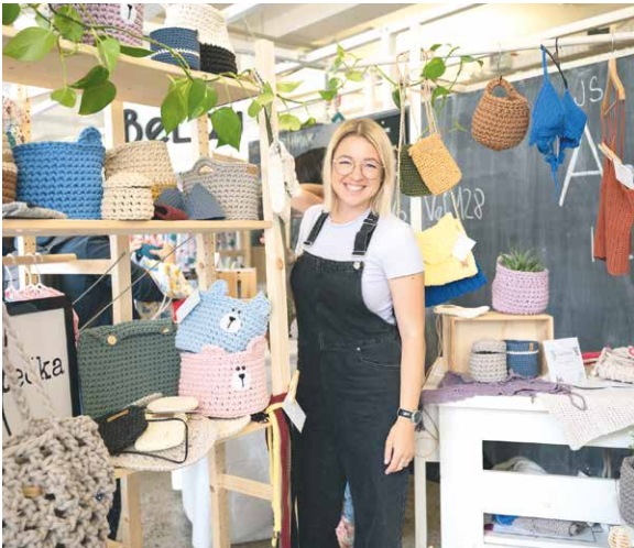
■ Nutností je na MINT Marketu dobrá nálada.