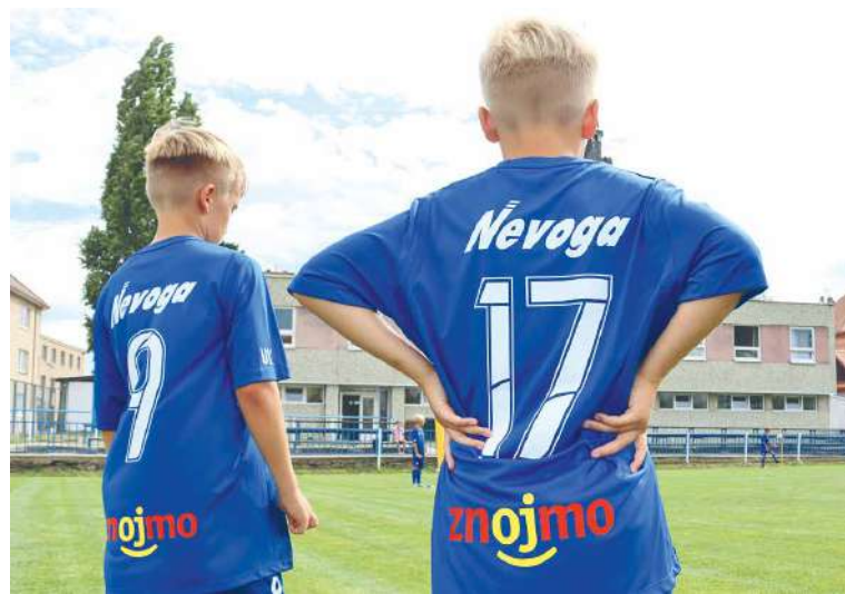
■ Na dresech fotbalové mládeže se objevilo logo nového sponzora, firmy Nevoga.