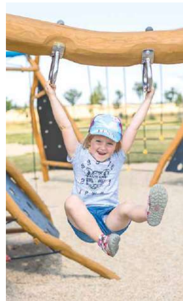
■ Prázdninové dny si nejvíce užívají děti, ale bohatá nabídka Znojemského kulturního léta cílí i na dospělé.

Navíc do konce prázdnin můžete každé pondělí, středu a pátek v centru města potkat od 21.00 hodin ponocného. Každý pátek jsou vám k dispozici projížďky zážitkového ekobusu Znojmaček (10.00 pro rodiny s dětmi, 17.00 pro dospělé). Denně jsou v nabídce prohlídky města s průvodcem, prohlídky hradebního opevnění, výstava Trnkova Zahrada 2 v klášteře Louka i prohlídky louckého kostela. Informace vám rádi sdělí i na TIC, Obroková ul. (tel. 515 222 552). lp