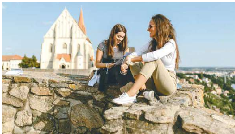
■ Festival nabízí i možnost degustace formou placených bločků.

Festival totiž probíhá v rámci Národní výstavy vín. Z přihlášených vzorků budou vyhodnocena vína postupující do celostátního kola Národní soutěže vín, aby se dále utkala o postup do finále a umístění v Salonu vín ve Valticích, kde se nachází stálá degustační expozice nejlepších vín z Moravy a Čech. O příjemnou atmosféru se postará Cimbálová muzika Antonína Stehlíka. Jednotné vstupné 500 Kč skýtá neomezenou konzumaci degustačních vzorků a lahev vína zdarma, kterou obdrží návštěvník při odchodu. lp