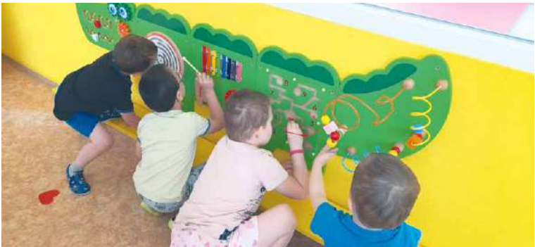
■ Krokodýl s labyrinty, které pomáhají dětem rozvíjet jemnou motoriku, zrakové vnímání, koordinaci a pozornost.

jim pomáhají zdokonalovat hrubou motoriku, stimulují obratnost, koordinaci i rovnováhu. Využít mohou také barevné chodníčky s různými povrchy mající příznivý vliv na hmatové vnímání. „Děti se lépe soustředí a zábavnou formou procvičují všechny svalové skupiny,“ uvedla Blanka Nováková, vedoucí pedagožka mateřské školy.