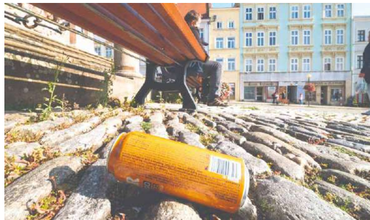
■ Kampaň bude cílit na osvětu ve třídění odpadů i skutečnost, že odpadky patří do koše, nikoli na zem či do přírody.

Znojmo již v březnu zorganizovalo dobrovolnickou akci Uklidme Znojmo, která se pravidelně koná pod záštitou Zdravého města Znojma. Nyní