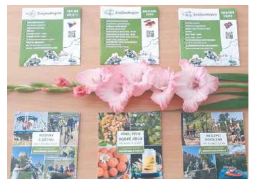
■ Letošní série šesti druhů skládacích letáků, které mají po rozložení formát A3.

i vytištění jsou také on-line na webu znojmoregion.cz . IN, lp