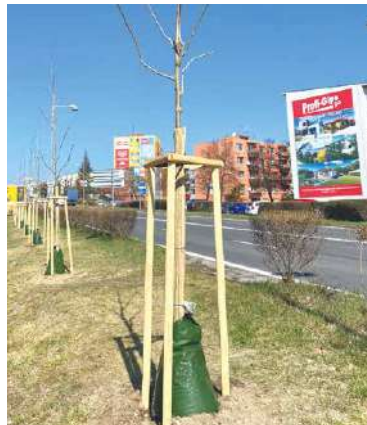
■ Nové platany se závlahovými vaky.

„Na zeleni a životním prostředí nám moc záleží. Díky našim příspěv-