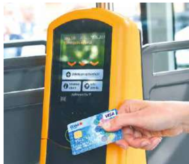
■ Validátor bude umístěn uprostřed autobusu. Ilustrační foto.