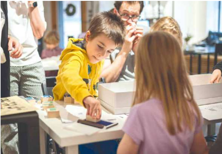
■ Galerie a Prostor podporuje kreativitu dětí.

Tvorba pro kreativní dospělé Pro dospělé výtvarníky má galerie GaP v nabídce dva kurzy výtvarné a novinku – umělecká řemesla. Ryze výtvarný kurz pro dospívající a dospělé reaguje na aktuální výstavy v GaPu a zároveň také rozvíjí další témata –