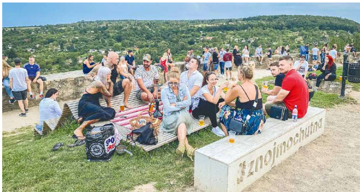
■ Nejen letní dny jsou ve Znojmě ve znamení pohody a setkání s přáteli.

přiláká malé i velké diváky. Jeden svět pro všechny je motto letošního Dne sociálních služeb na Horním náměstí a u sedlešovického mostu si rozhodně nenechte ujít Festival dračích lodí. O všech aktivitách se více dozvíte uvnitř LISTŮ. Navíc k blížícímu se Znojemskému historickému vinobraní připravujeme speciál s celým programem. Vyjde 1. září 2022. lp