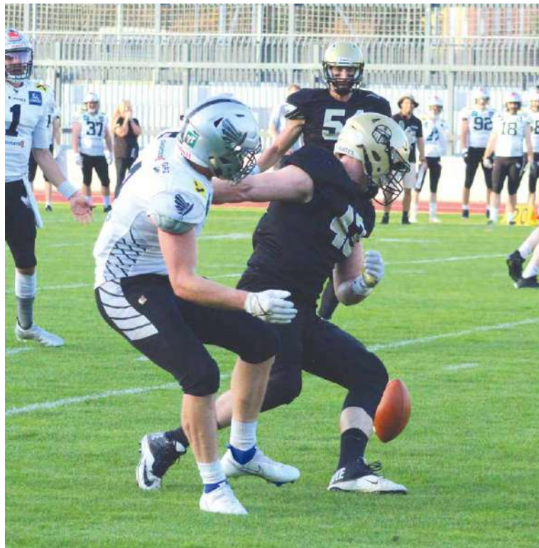
■ Rytíři v sobotu večer porazili Raiders Tirol jednoznačně 55:15.

„Bylo to pro nás velké vítězství. Ne každý den se vám podaří vyhrát