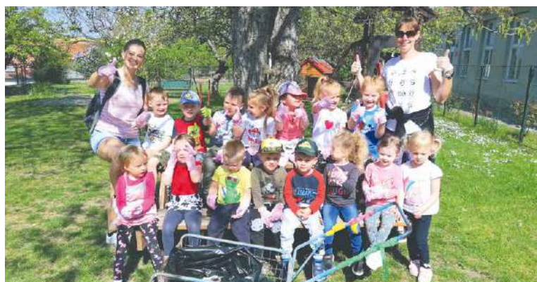
■ S úklidem pomáhaly i děti ze třídy Sluníčka z mateřské školy v Mramotících. Stejně jako ony i další dostaly za snahu sladkou odměnu.

V průběhu celého května uklízela tisícovka dětí nepořádek a černé skládky v blízkosti svých škol a jejich okolí.