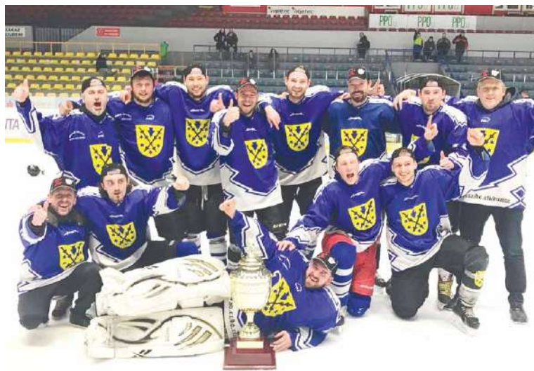
■ HC Třinec – vítěz divize A 2022.