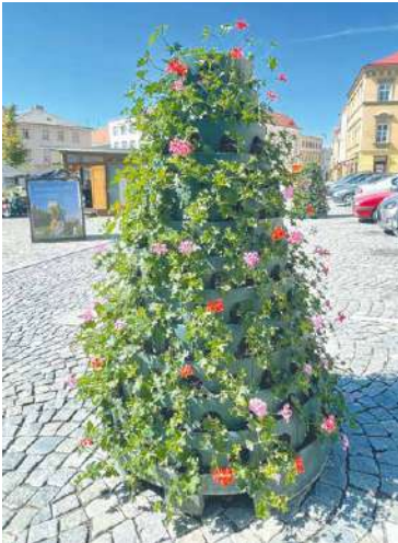
■ Květinovou skladbu v nádobách tvoří surfinie, pelargonie, ipomea, begonie, osteospermum, pařížské kopretiny, canny, bidens, plectranthus a další druhy odolné místnímu horkému klimatu.