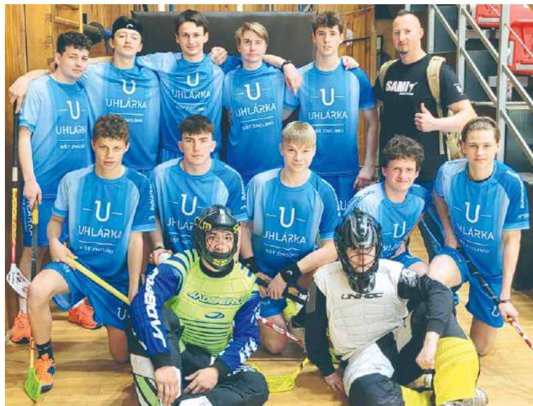
■ Výběr školy obsadil ve florbalovém turnaji středních škol vynikající 3. místo, čímž navázal na úspěchy z minulých let.

letošní sportovní sezóna. Úspěch potvrdil, že na škole mají talentovaní sportovci stále uplatnění. Nyní už sportovci nabírají kondici na nadcházející sezónu. lp