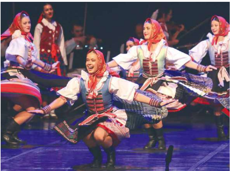
■ SLUK je vyhlášen půvabnými tanečnicemi.