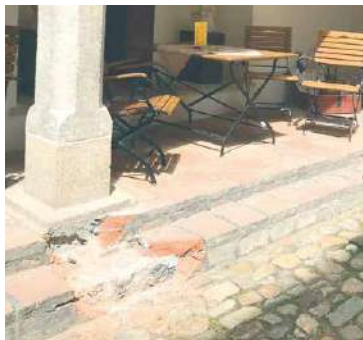
■ Dlažba ambitu bude snížena na úroveň nádvoří. Odkryje se tím i patky sloupů.

Městský dům je goticko-renesanční stavbou z druhé čtvrtiny 16. století s jednoduše členěnou fasádou. Budova je kulturní památkou, proto rekonstrukce probíhá pod dohledem památkové péče. V prostoru vstupu, ambitu, schodiště a ochozů dojde k výměně dlažby. Částečně bude vyměněna střešní krytina, kompletní rekonstrukci projdou toalety. V prostorách schodi-