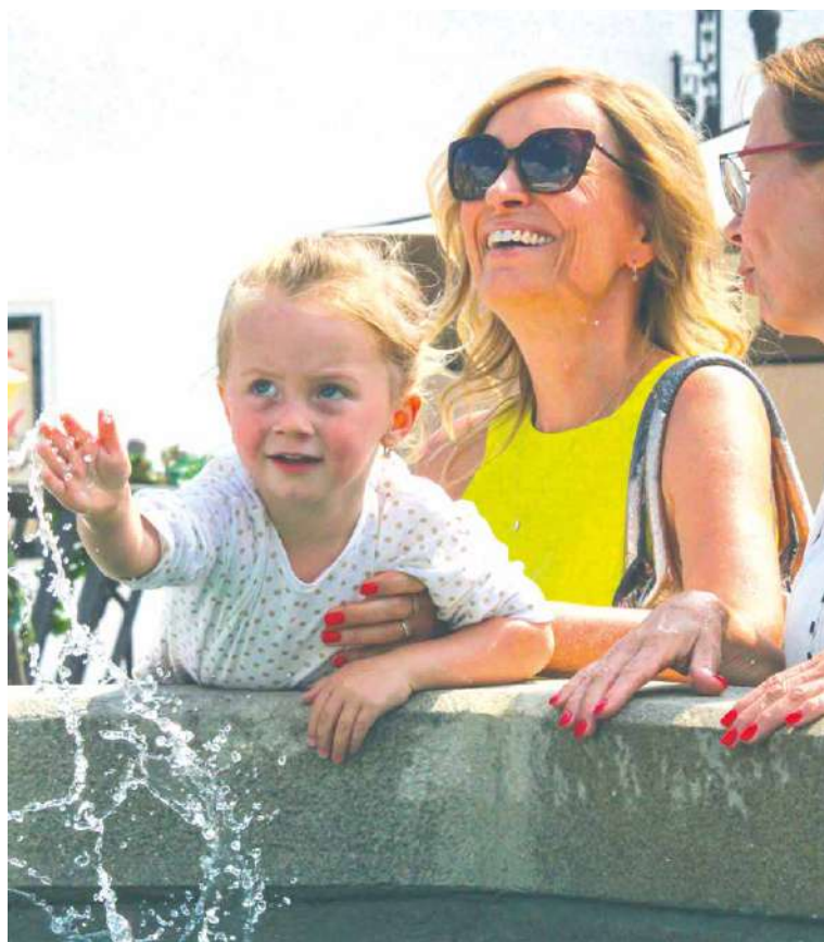
■ Léto je v plném proudu, tak si ho ve Znojmě užijme do sytosti.