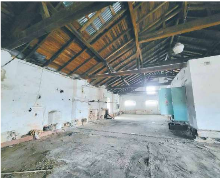
■ Impozantní prostor pod střechou budovy zaniklého pivovaru doznává změny.

„Jedná se o velký projekt, který chceme samozřejmě prodiskutovat s veřejností. Proto k tomuto záměru proběhne veřejná prezentace,“ konstatoval starosta Malačka. sb, lp