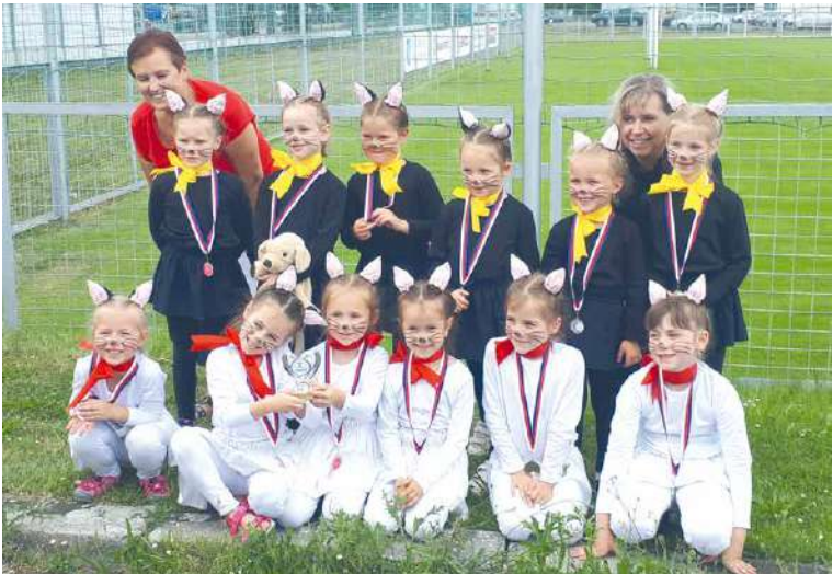
■ Stříbrné Kočky se svými pedagožkami.

jím devátém místě! V pohybových aktivitách podporuje školu také město Znojmo, v tomto případě finančním zajištěním dopravy na soutěž. Mateřská škola Dělnická vede děti k pohybu po celý rok. V červenci také zorganizovala na Městském stadioně ve Znojmě již třetí ročník miniatletických závodů pro děti mateřských škol. Na start se postavily stovky malých sportovců a medaile tak putovaly vedle domovské školky i do MŠ Pražská, Slovenská, nám. Armády, nám. Republiky, Holandská, Přímětice, na Olbramkostel, do Kravska a Hnanic.