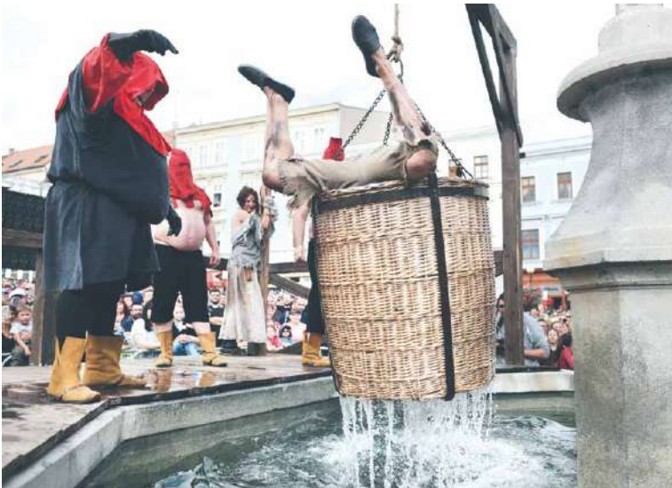
■ Uličníky, co pančují víno, ztrestá král máčením v kašně.