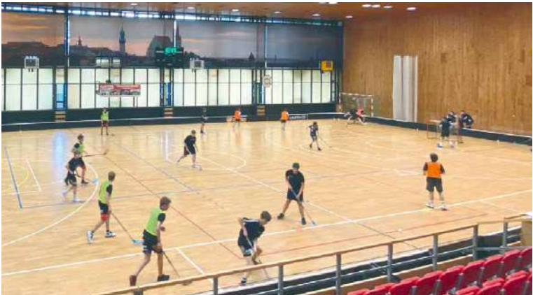
■ Sportovci se po prázdninách proběhnou po moderním povrchu haly.