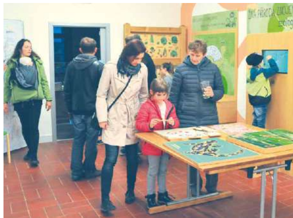
■ Muzejní noc vítá všechny generace.

Hlavní téma letošní Muzejní noci je Hravý středověk. S celou rodinou či přáteli se do něho můžete ponořit v pátek 20. května.