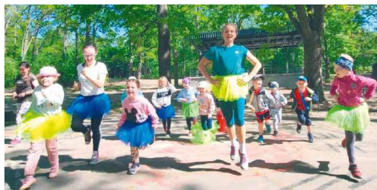
■ Děti si den s gymnazisty užily.