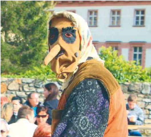
Na filipojakubské noci řadí všelijaké čarodějnice.

Letošní filipojakubská noc zve ve Znojmě hlavně děti, které si mohou lidový zvyk užít společně s rodiči či prarodiči nebo kamarády a strávit tak hezký dubnový večer. Pohanský zvyk pálení čarodějnic začne za Vlkovou věží v 16.00 hodin chill party a s DJ Izzy Cooperem potrvá do 20.30 hodin. Po zahradě budou rozmístěny koše s ohni. U několika menších ohnišť tak bude možné opět si špekáček – vlastní nebo na místě koupený v prodejním stánku s jídlem a pitím, o které se postará Občerstvení U Dyje. U ohně si od 20.30 do 23.00 hodin zahrájí také muzikanti na Jam Session. Během magické noci se čarodějnice na svém shromáždění radují ze všeho zlého, co napáchaly. Poté se