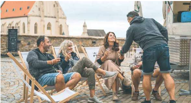
Jídlo na street food festivalu lidi stmeluje a přispívá k dobré náladě.

chané drinky nebo víno z rodinných vinařství a spousta dalšího. Přijďte si do areálu pivovaru užít dva festivalové dny, a to v pátek od 12.00 a v sobotu od 10.00. Letos si pro vás organizátoři připravili tematický doprovodný program, živou hudbu, cimbálovou muziku nebo interaktivní zóny od partnerů. „Děti budou moci jezdit po areálu na elektrokoloběžkách či longboardech a dospělí mohou vyzkoušet virtuální realitu či jízdy elektroautomobily značky Škoda. Těšíme se na vás,“ zve za organizátory Lucie Matulová. Záštitu nad akcí převzalo město Znojmo. lp