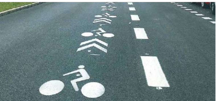
Piktogram cyklokoridoru má podobu cyklisty a směrového znaku – šípky. Nové opatření bude ve městě použito poprvé. Ilustr. foto

Novinkou budou ve Znojmě také tři servisní cyklostanice umístěny v lokalitách, kde je pohyb cyklistů nejfrekventovanější – u Městské plovárny Louka, u parkoviště na ulici Koželušská a na Hradišti u obchodu. Stanice jsou vybaveny šroubováky, sadou imbus a torx klíčů, montážními pákami a pumpou. Využít je bude moci veřejnost také k opravám koloběžek či kočárků. lp, sch