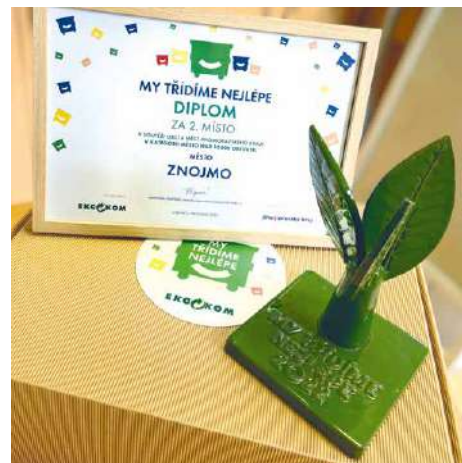
■ Ocenění pro Znojmo.

kazovaná data v systému EKO-KOM, především množství vytríděných odpadů na jednoho obyvatele a počet tříděných komodit na území jednotlivých obcí a měst. Výsledky byly hodnoceny za období od 4. čtvrtletí 2021 do konce 3. čtvrtletí letošního roku. Hodnocena byla, mimo jiné, i hustota sběrné sítě a sběr nápojových kartonů či kovových odpadů.