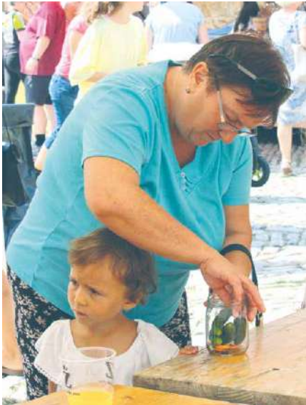
■ Divácký lákavá soutěž v plnění okurek na čas.