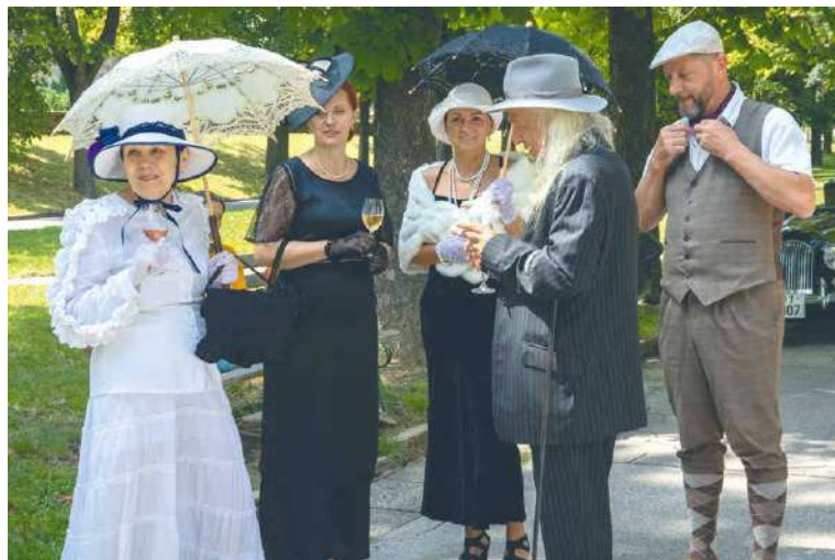
■ Promenádní koncert připomene půvab časů minulých.