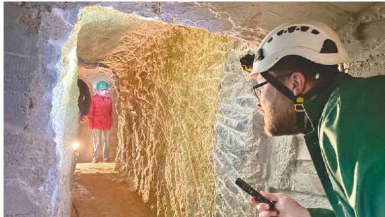
■ Chodba v krytu.