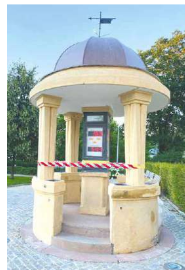
■ Meteorologický altánek stojí na Komenského náměstí.

V rámci současného restaurátorského průzkumu omítkových vrstev památky bylo zjištěno, že pod vrstvou novodobé omítky se nachází původní teracový povrch žluto-okrové barvy. Dále bylo odhaleno, že schody s podestou, strop, kovová konstrukce přístroje a plechová střecha byly původně provedeny v červené barvě. Původní nátěr plechové střechy dokládají červené kapky, které byly objeveny na římsě pod štukem. Zjištěné barevné schéma odpovídá českému národnímu stylu 1. republiky. Barevný koncept je zřejmě odvozen od heraldických