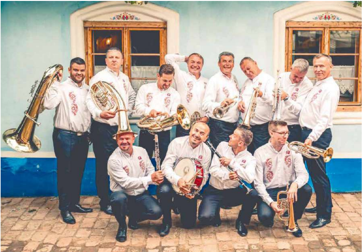
■ Nejen s hráči Moravské 12 bude na prvního máje hodně veselo.

V 15.00 hod. Jihočechy vystřídají AMATÉŘI Z DOBŠIC . Od svého založení roku 2000 vystupují jako první a jediná krojovaná kapela v regionu Znojemska. Slovo amatér v názvu není náhoda. Vzniklo z latinského slova amare – milovat. Amatéři toto slo-