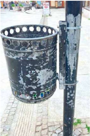
■ Vzhled původního a nového odpadkového koše.

V současné chvíli je v městské památkové rezervaci 151 kusů košů. Postupně dojde ke sjednocení typu používaných nádob na celém území historického jádra města. sch