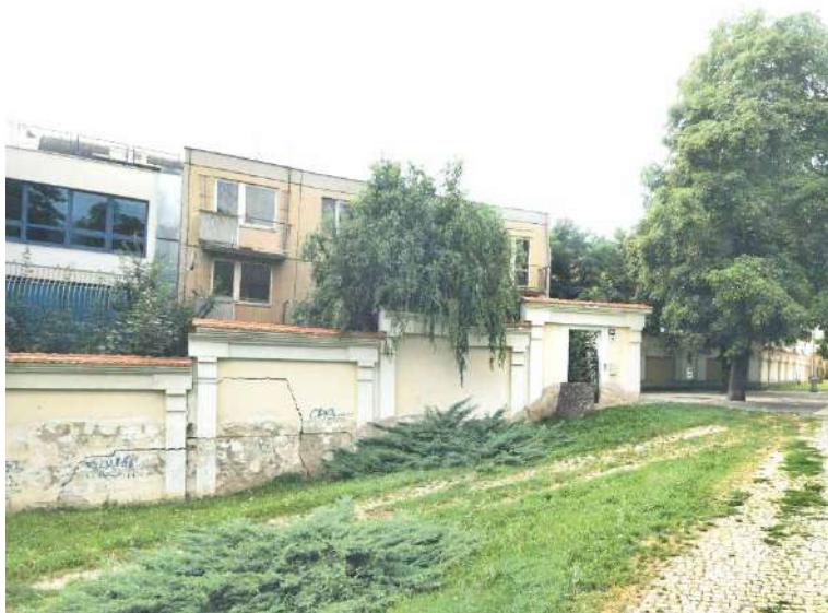
■ Dům dříve sloužil jako bydlení pro úředníky Komerční banky, teď ho čeká demolice.

Pochází z počátku 80. let a je již několik let nevyužívaný a ve špatném technickém stavu. Navíc se žádným vhodným využitím nehodí do prostoru Horního parku, který bude v budoucnu revitalizován. Město proto přistoupilo k jeho demolici. Průchod Horním parkem bude pro kolemjdoucí z důvodu pohybu těžké techniky částečně omezen. Demoliční práce by měly začít v druhé polovině srpna a potrvají přibližně dva měsíce. sch