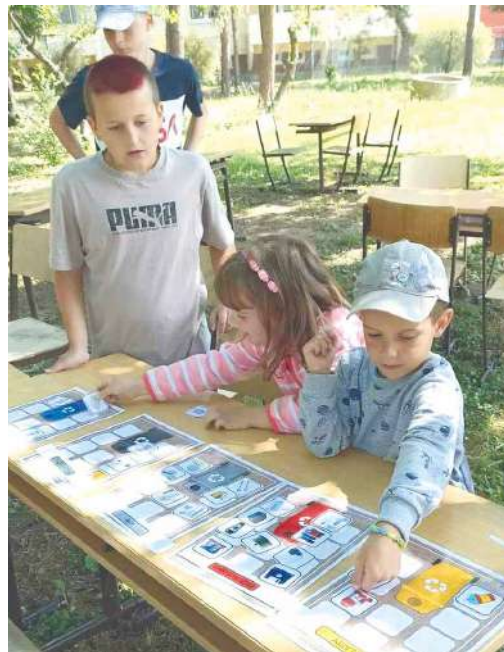
■ Během roku se z MŠ Pražská v ZŠ vystřídaly všechny třídy dětí.

Náplní kroužku přírodovědných badatelů je provádění experimentů, řešení přírodopisných problémů, laboratorní práce a mikroskopování. Kroužek pod vedením učitelky Jarmily Olejníkové je pro žáky 2. stupně ZŠ, které baví přírodopis a rozvíjí vědomosti a dovednosti v oblasti přírodních věd. Během roku starší kamarády navštěvovali děti z mateřské školy Pražská, aby se dozvěděli více o přírodě. lp