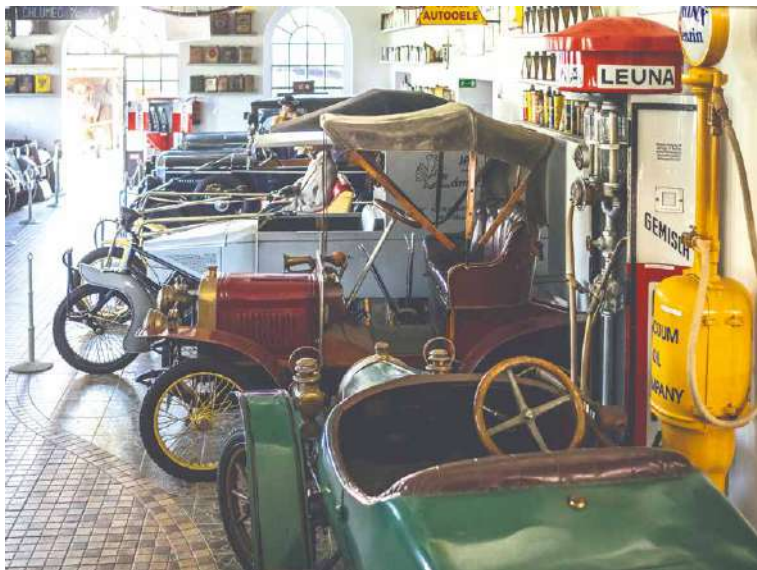
■ V Muzeu motorismu stojí desítky unikátů. Mezi automobilovými vyniká Laurin & Klement Voituretta z roku 1905 a KAN z roku 1911 (oba v popředí).

Uvnitř muzea se rázem ocitnete v době předválečné. Všude kolem vás se nachází přehledně roztříděné exponáty, o které se majitel s láskou stará. Všechny stroje a vozy, motocykly, motokáry a další vozidla si sám renovuje, a tak většina je i přes svůj úctyhodný věk ve velmi zachovalém stavu, funkční či pojízdná.