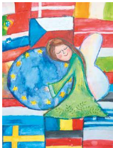
■ Vítězné dílo znojemské žákyně.