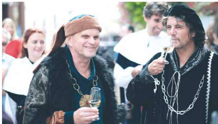
■ Mázhauzy otvírají na vinobraní konšelé.