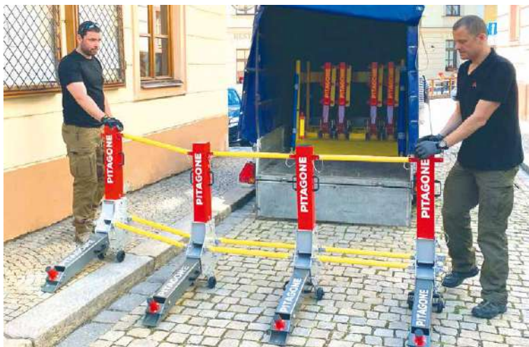
■ Bariéry F-11 zastaví vozidlo až do 7,5 tuny váhy.

Kompletně sestavené mobilní bariéry je možné také rychle odstranit z vozovky, například při nutnosti průjezdu sanitky. „Doufám, že budou ve Znojme použity vždy jen preventivně. V dnešní době je ale potřeba být připraven než být překvapen,“ dodává starosta Jakub Malačka. sb, lp