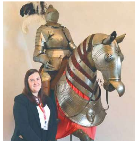
■ K prohlídce přidávají vždy milý úsměv.

Od začátku studia prestižního oboru procházejí studenti odbornou přípravou, vzdělávají se v průvodcovství, dějinách umění, právu, zeměpisu, v cizích jazycích a nedílnou součástí je také praxe, třeba na památce, jakou je hrad Bítov. Studentky se zde svého úkolu zhostily na výbornou. S nadšením a erudiicí sobě vlastní provází návštěvníky interiéry i hradní kuchyni, co si v ní zahrál prince Tomáš Klus, a přidají další zajímavosti. „Zlatým hřebem prohlídky je světově unikátní sbírka 51 vycpaných psů z baronova psince. Jen musím návštěvníkům trpělivě vysvětlovat, že baron zvířata miloval, nezabíjel je, honů se takřka neúčastnil. S milovanými psy se obtížně loučil, proto je