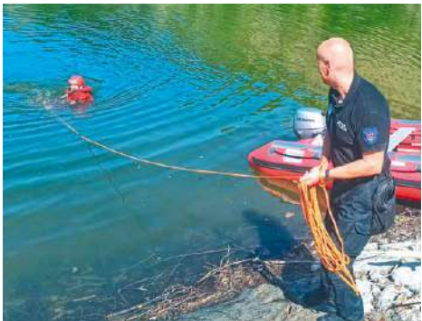
■ Strážníci trénovali efektivní pomoc tonoucímu.

nákup, kterým můžete ohrozit jejich život! Je-li venku teplota 28 °C, v autě může být za pár minut přes 50 °C. Myslete na to, jde o Vaše nejbližší!“ V rámci prevence také strážníci pravidelně navštěvují domy se zvláštním určením, ve kterých bydlí senioři. Cílem je starším spoluobčanům připomenout, jak se chovat, aby nesedli na lep různým podvodníkům ať už při osobním, telefonickém či internetovém kontaktu. Obdobné besedy dělají preventisté Městské policie i na znojemských základních školách. lp, zdroj: MP Znojmo