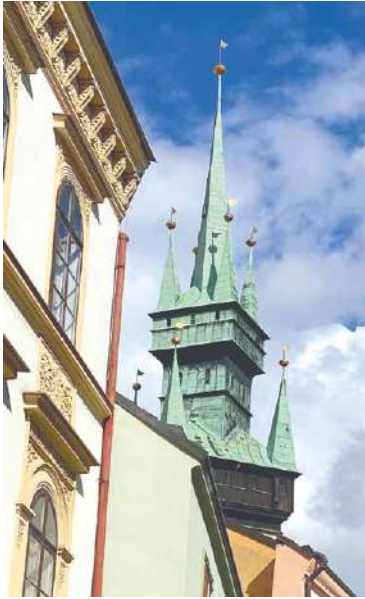
■ Zelenou střechu čeká oprava.

Vyplňte online formulář, který najdete na webu portal.muznojm.cz/radnicevez nebo je ke stažení na webu znojnocity.cz v záložce Významné investiční projekty. Ten následně zašlete poštou na adresu Městský úřad Znojmo, Obroková 1/12, 669 02 Znojmo