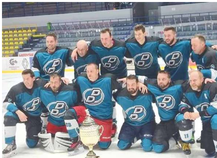
■ Dolní Dubňany – vítěz divize B 2022.