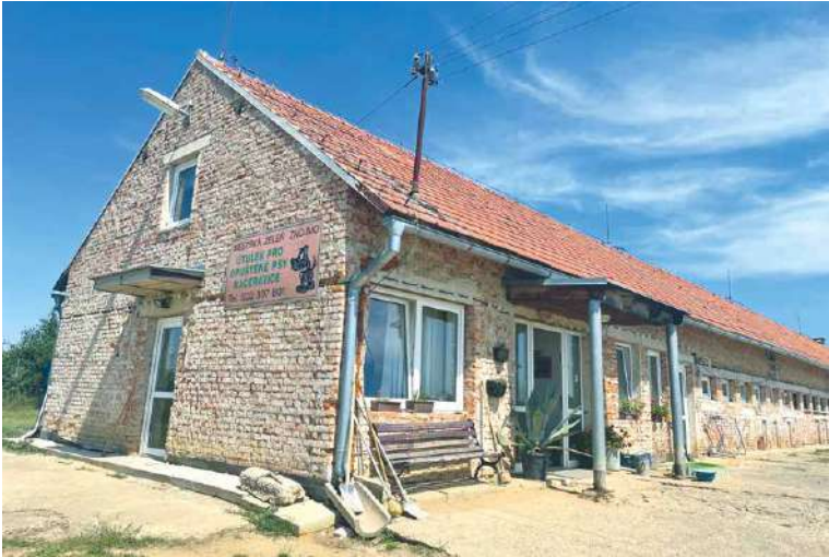
■ Městský útulek pro opuštěné psy a kočky dostane nejen novou fasádu.

Stavební práce začaly v červnu. Útulek dostane nové vnější omítky, okapový chodník kolem objektu a zpevněnou plochu u vstupu do objektu. Zrekonstruován bude i vstupní přístřešek. Část objektu bude zateplena