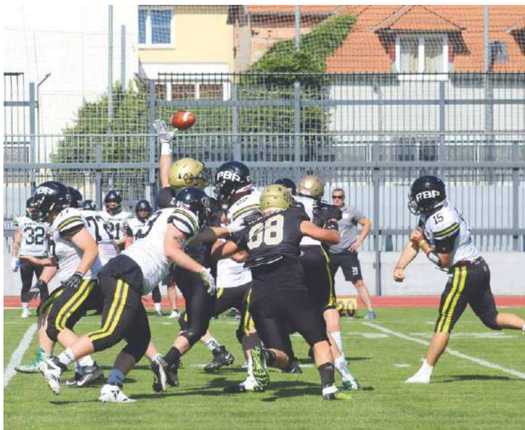
■ Záběr z domácího zápasu proti Prague Black Panthers.

Jeho tým si ale udržel naději na postup do vyřazovacích bojů až do závěrečného utkání, ke kterému Rytíři nastoupili na hřišti Telfs Patriots. V bouřlivé atmosféře před ti-