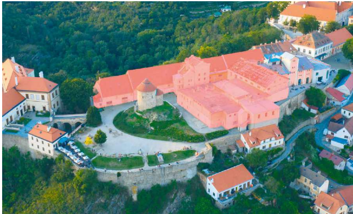
■ Rozsáhlá rekonstrukce v areálu pivovaru se bude týkat všech vyznačených budov na snímku.

ným způsobem zapsali do současné podoby areálu. Stále v něm ale zůstávají nevyužité objekty. Město Znojmo proto aktuálně uzavřelo memorandum s Vinařstvím LAHOFER, a.s., které by mělo nevzhledné a nevyužívané budovy přeměnit na unikátní vinařský prostor. Inspiraci našli Lahoferští v zahraničí. Více na str. 3. sb, lp