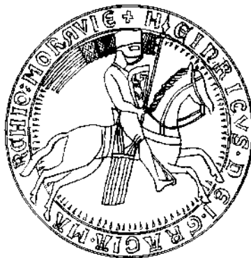
■ Pečeť Vladislava Jindřicha.