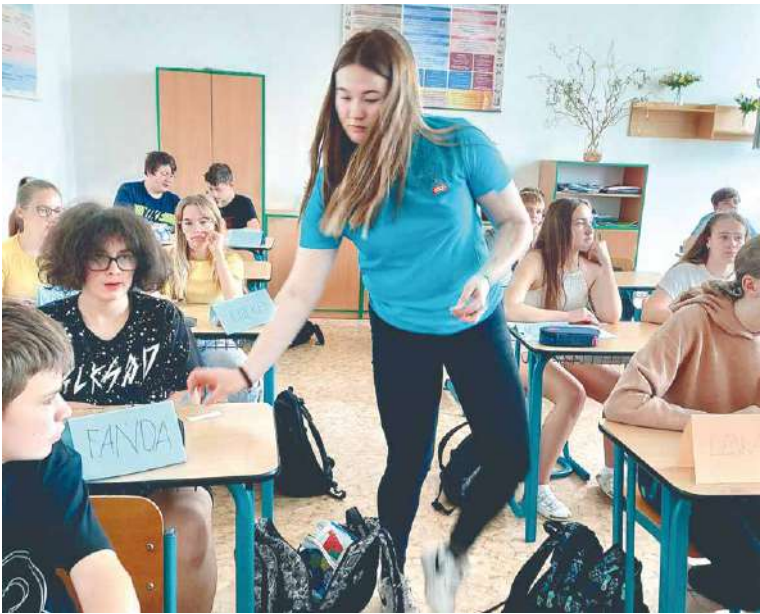
■ Prezentace o poruchách příjmu potravy na základní škole v Kravsku.