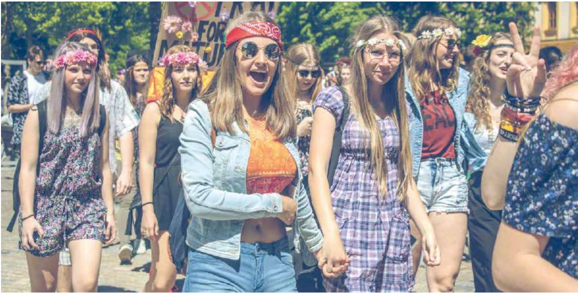
■ Mladí lidé si umí svůj svátek užít.