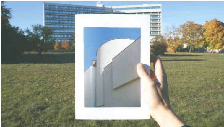
■ Muzejní publikace roku 2021.

obálkou, ale jednoznačným názvem Znojmo 1918–2020: architektonické proměny. V květnu za ni převzali autoři projektu a vedení muzea 2. místo v Národní soutěži muzeí Gloria musaealis – kategorie Muzejní publikace roku 2021. Kniha prorazila mezi devětadvaceti přihlášenými publikacemi z celé České republiky a nechala za sebou i knihy z produkce Národní galerie ČR či Národního technického muzea.