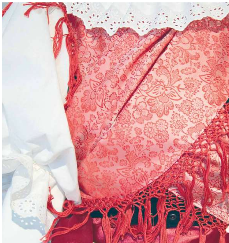
■ Lidové umění našich předků vystavují na hradě.

Návštěvníci si však budou moci prohlédnout také desítky nových exponátů, které se do muzejní sbírky