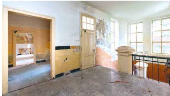
■ Centrum Louka se veřejnosti otevřelo letos v březnu po radikální rekonstrukci (prostory bývalé školy před a po).

CENTRUM LOUKA A KOSTEL NANEBEVZETÍ P. MARIE A SV. VÁCLAVA. Každou hodinu od 9.00 do 17.00 komentované prohlídky, vždy max. 15 osob. Nutná rezervace na tel. 537 020 700 nebo přímo v Centru Louka. sb, lp