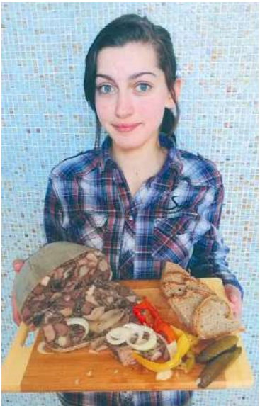
■ Žákyně oboru Řezník–uzenář se svým řemeslným výrobkem.

A to nejen získáváním teoretických znalostí a praktických dovedností, ale také zvyšováním svých prezentačních schopností při tvorbě odborné práce a její obhajobě. Jak jsou připraveni, předvedli v březnové přehlídce. Zapojilo se do ní sto pět žáků posledních ročníků. Více než 42 % z nich vypracovalo špičkovou práci, kterou obhájili s výborným prospěchem. „Žáci si vybrali téma práce zaměřené na podnikatelský záměr nebo řemeslný výrobek včetně finanční kalkulace. Pod vedením svých odborných učitelů práci zpracovali a při obhajobě ji slovně nebo ukázkou prezentovali před hodnotící komisí a svými spolužáky. Ústní prezentace jim umožnila také provést sebereflexi své práce. Činnosti spojené s odbornými pracemi posilují osobnostní vývoj žáků, jejich socializaci a schopnost kooperace. Vedou žáky