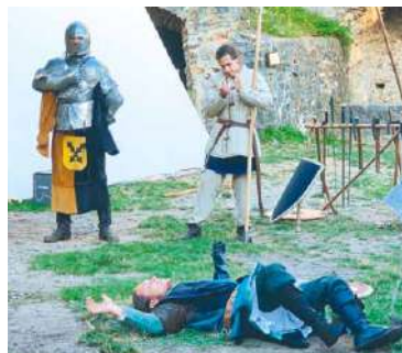
■ Na Cornštejně potkáte třeba udatné rytíře.

V sobotu 23. července bude na Cornštejně celodenní jarmark s ukázkami