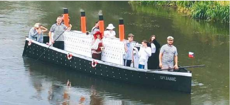
■ Na hladinu řeky Dyje vypluje naposled obří Dyjanic.

Pod znojemskou přehradou se v neděli 28. srpna projedou po řece Dyji bláznivá plavidla 11. ročníku Neckyády.