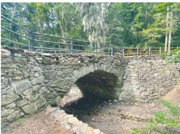
■ Už čtvrté století slouží lidem most spojující starobylé Hradiště a centrum Znojma.

Kamenný most nacházející se v Gránickém údolí je památkově chráněnou stavbou pocházející patrně ze 17. století. V jarních měsících byly na mostě zahájeny práce na odstranění statických poruch kamenné konstrukce a přilehlých opěrných stěn. Proveden byl nový zásyp klenby a most