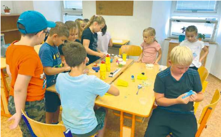
■ Letní škola na Základní škole Václavské náměstí.

V letošním druhém ročníku poskytlo město školám pro realizaci potřebnou finanční podporu ve výši 696 773 Kč. Do projektu se zapojilo pět základních škol zřizovaných městem