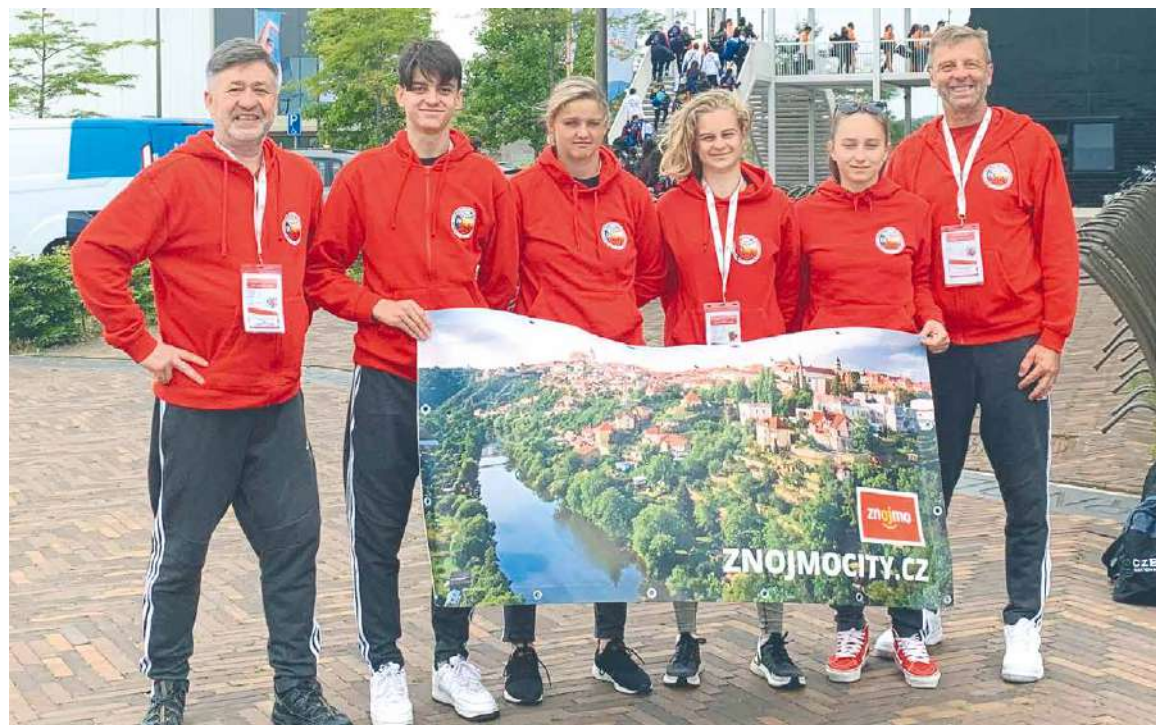
■ Znojmská výprava na mistrovství světa v Nizozemí.

světa. Účast byla možná díky finanční podpoře Města Znojma, za což naši reprezentanti děkují. abe