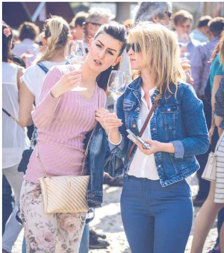
■ Festival je příležitostí k přátelským setkáním.

Hlavní kulturní program festivalu bude situován na Horní náměstí, kde