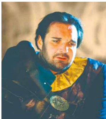
■ Adam Plachetka v roli Saula z Händelova oratoria .

Už po osmnácté nabídne Hudební festival Znojmo neotřelé zážitky z inspirující hudby, koncertních míst i chutí vín snoubených s uměním. Ročník s podtitulem Andělé strážní a návraty domů se uskuteční 8. až 24. července 2022.