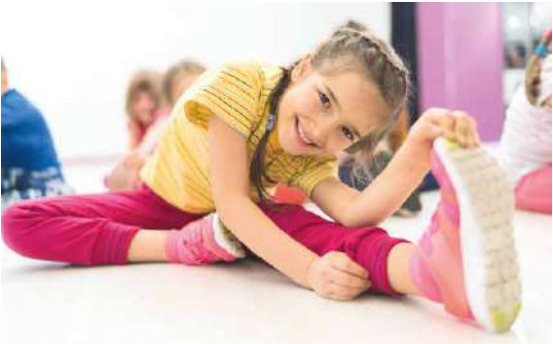
■ Sportovní kroužky jsou dětmi vyhledávané.

Rada města se zabývala i možnostmi budoucí podpory kroužků pro děti. „Rozhodně budeme podporovat mimoškolní aktivity dětí i nadále. Obzvláště se budeme snažit podporovat rodiče a děti s ohledem na aktuální nepříznivou ekonomickou situaci. Přesto se budeme zamýšlet nad nastavením dotačního programu, abychom podporovali na prvním místě ty, co to skutečně potřebují,“ uvedl místostarosta Znojma Jan Blaha. sch, lp