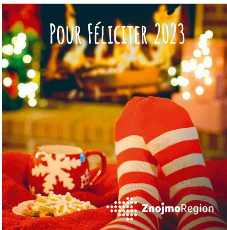
■ ZnojmoRegion přeje všem čtenářům radostné Vánoce a šťastný Nový rok.

Nejde přitom o zcela nový portál ZnojmoRegionu, ale o výrazně upravený původní web, který prošel vizuálním a obsahovým upgradem a zásadním rozšířením funkcí uživatelských i administračních. Těto změny si letos v listopadu navíc povšimli i renomovaní odborníci – spolek KvaliKom, sdružující nezávislé profesionály a specialisty na komunikaci. Ten vyhodnotil novou podobu webu ZnojmoRegionu jako druhou nejlepší v Jihomoravském kraji a sedmnáctou v ČR. Ze stovek tuzemských turistických portálů se jich přitom do soutěže samotné zařadilo k hodnocení celkem šedesát. IN