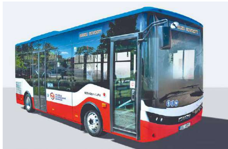
■ Minibus ISUZU NOVOCITI LIFE využívá k přepravě cestujících například hlavní město Praha. Od nového roku budou jezdit tři i ve Znojmě.

autobusy detailně prohlédnout, zodpovíme případné dotazy a od 12.00 hodin zahájíme ukázkové jízdy,“ popisuje