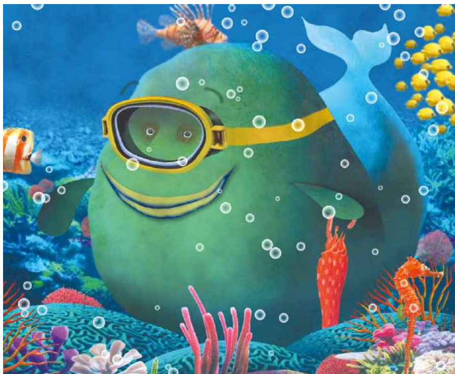
■ Mluvící velrybu najdete ve velrybáriu.