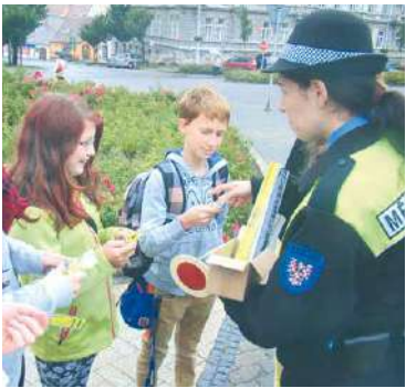
■ Ilustrační foto

Klub Coolna, spadající pod Oblastní charitu Znojmo, je nízkoprahové zařízení pro děti a mládež od 11 do 26 let. Všeobecně se pracovníci klubu, včetně streetworkerů, spolupodílejí na zlepšení kvality života dospívajících a předchází či snižují rizikové chování prostřednictvím odborné pomoci, preventivních programů, výchovných a aktivizačních činností či vzdělávacích a volnočasových aktivit. sb, lp