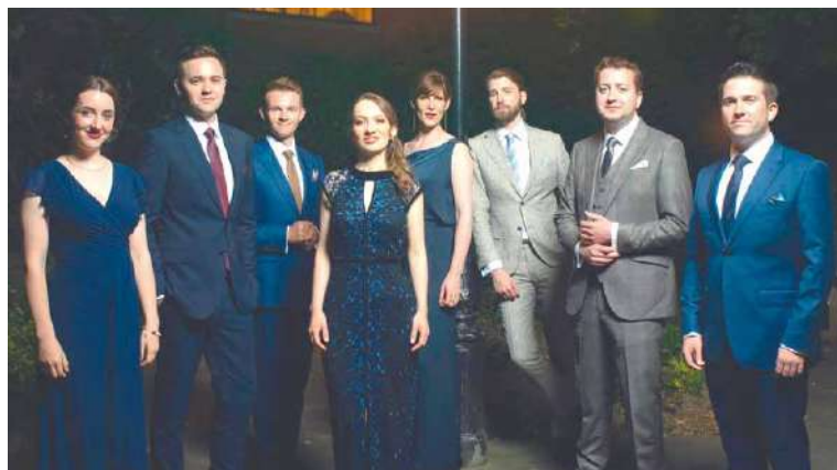
■ Koncert britského souboru VOCES8 bude patřit mezi vrcholy letního festivalu.