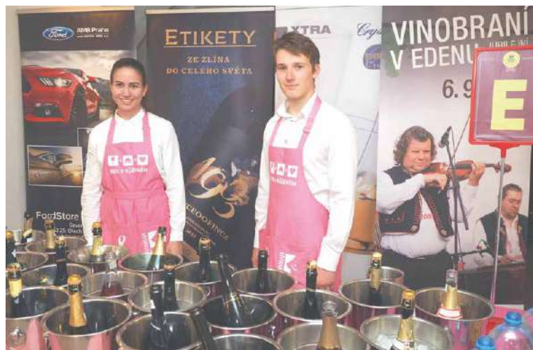
■ Obsluha v růžové už pomalu chladí vína pro návštěvníky Jarovínu rosé 2022.

ný a přidává osobní pozvánku: „Dva roky jsme nemohli, snad teď budete moci vy! Všechny milovníky bublinek a růžových vín zveme na jedinečnou degustaci národní soutěže rosé a klaretů JAROVÍN ROSÉ 2022, která se koná v předvečer představení nových vín VOC Znojmo.“ Město Znojmo se opakovaně stalo partnerem soutěže, ale skvělá vína budete moci až do června ochutnat i v dalších měsících (více na webu jarovin.cz). A když přijdete na JAROVÍN ROSÉ stylově oděni v růžovém, nebo třeba s růžovým účesem, budete se skvěle vyjímat na fotografiích z oblíbené akce. lp