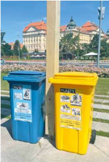
■ Návštěvníci plovárny Louka mohou třídit odpad i v tomto prostoru.

Pravidla na hřbitovech Nové kontejnery přibýly také Na Centrálním a Louckém hřbitově, kde je nyní možné vyhodit zvlášť plast a bioodpad. „Vytvořili jsme infopanel, který přesně specifikuje, kam který odpad patří nebo naopak nepatří. Třídění zde budeme pečlivě kontrolovat. Správné třídění je totiž důležité pro další zpracování odpadu,“ doplňuje Jakub Malačka.