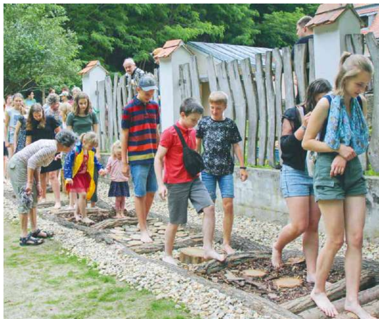
■ Všem, kteří chůzi naboso vyzkouší, může prospět na těle i na duši.